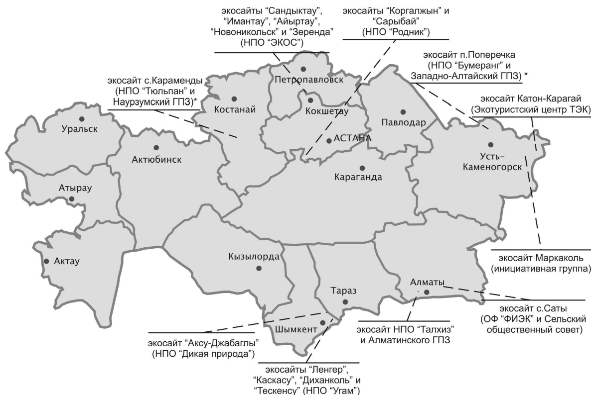
Рис. 5.1 Ситуационный план-схема месторасположения экосайтов

Примечание: Экосайты, отмеченные *, на момент подготовки Руководства находились на этапе создания.